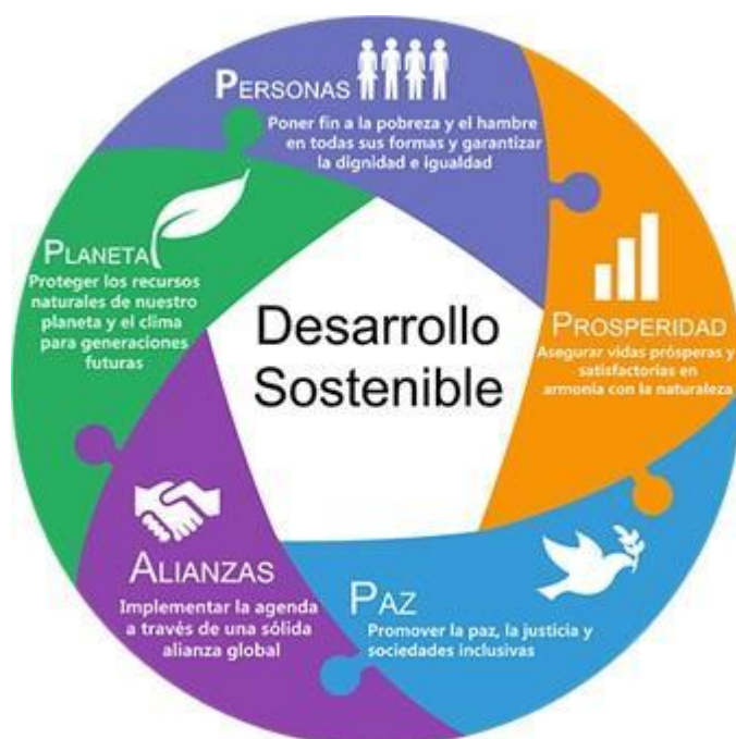
Imagen obtenida de https://www.cidob.org/publicaciones/documentacion/dossiers/dossier_ods_2015_2030/objetivos_de_desarrollo_sostenible_la_agenda_2030_del_compromiso_a_la_practica/en_que_consisten_los_ods Solo para fines educativos.

Solicítales que identifiquen cuál de las cinco clasificaciones se alinea mejor a su propósito de vida.